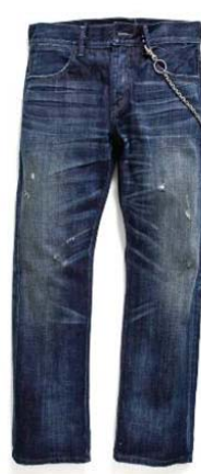
Heartbreak Hotel EU504-0056 ¥799