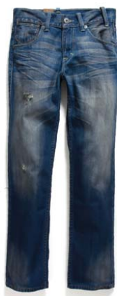
Doo Wop EU504-0046 ¥899