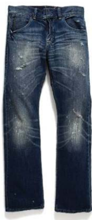
Les Paul EU511-0097 ¥899

摇滚亦与今季主题“Sound Wash”互相紧扣。音乐的跃动代表了年青人无穷的活力, 音乐的“Sound”与牛仔裤的“Wash”连成一线, 发展成今季 Square Cut Jeans「全新方正剪裁」的洗水基础。